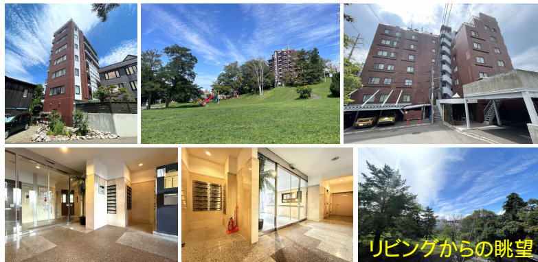
リビングからの眺望