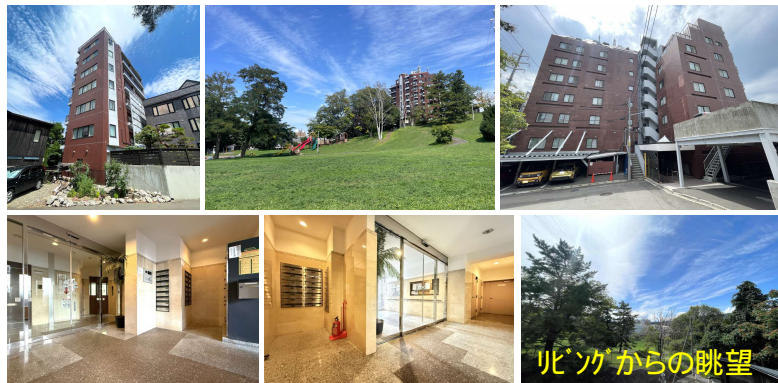
リビングからの眺望