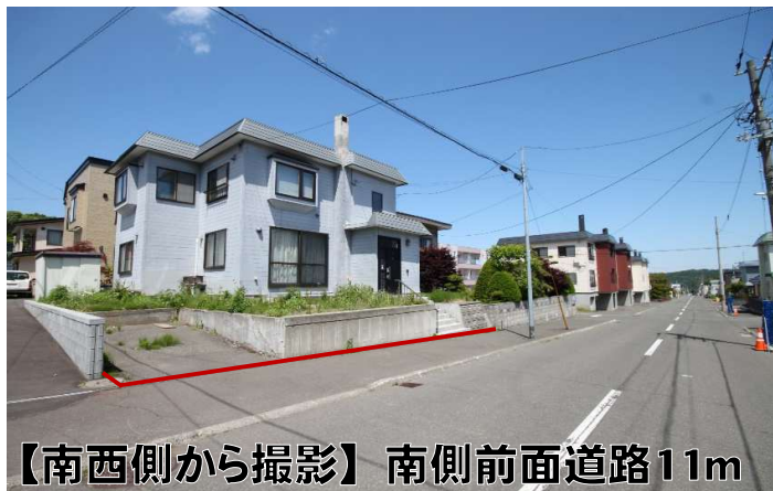
【南西側から撮影】 南側前面道路11m